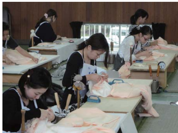
▲技能五輪全国大会