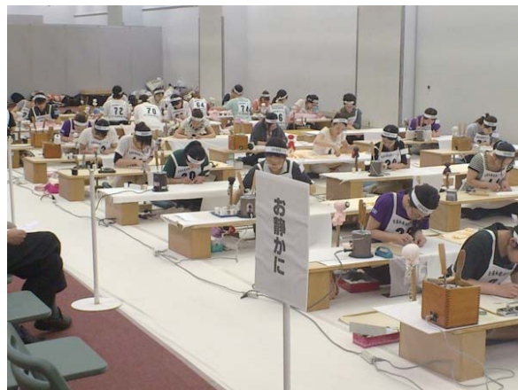
▲日本和裁士会全国コンクール