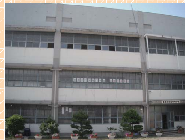
熊本市技術専門学院 校舎