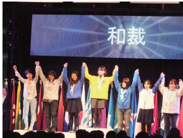
▲技能グランプリ表彰式（銀賞）